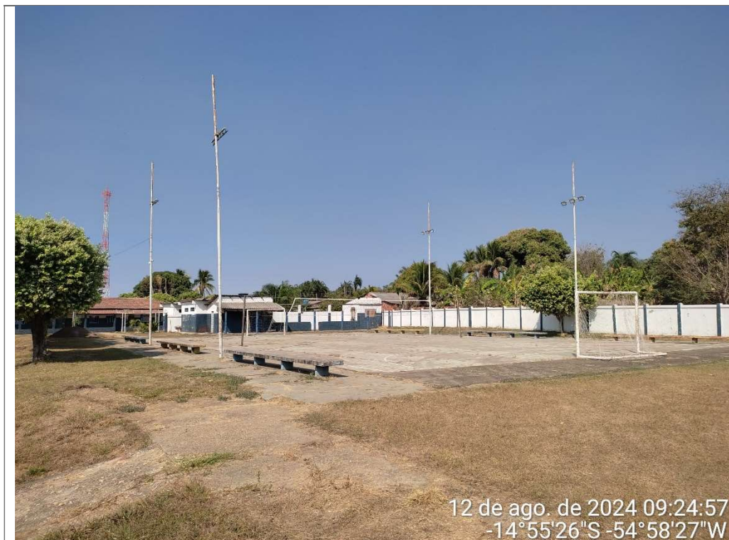
QUADRA POLIESPORTIVA EXISTENTE