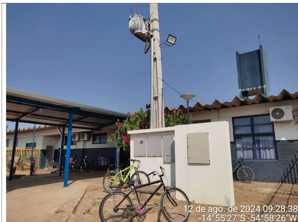
ENTRADA DE ENERGIA ELÉTRICA