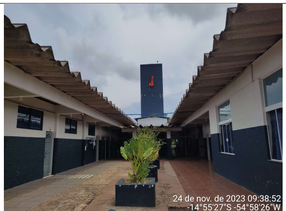
BLOCO 1 E 2