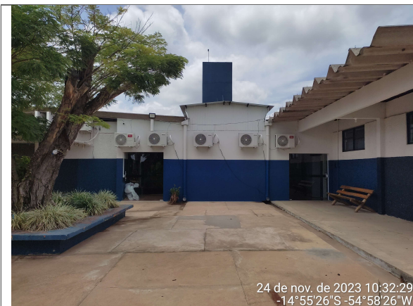
REFEITÓRIO - EXTERIOR