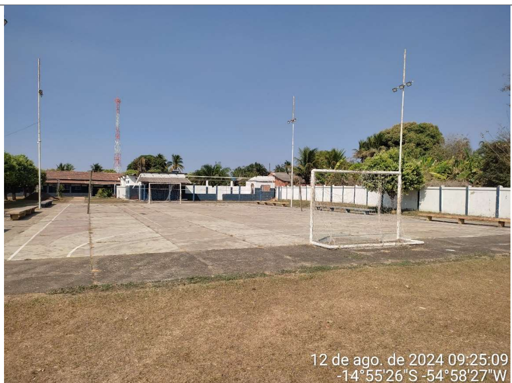
QUADRA POLIESPORTIVA EXISTENTE