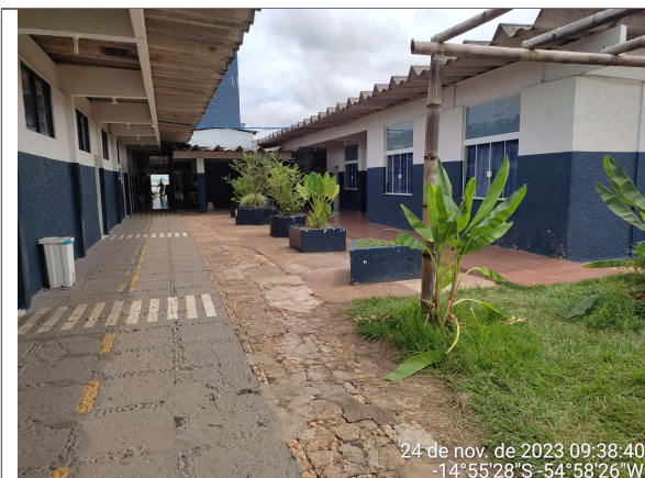
BLOCO 1 E 2