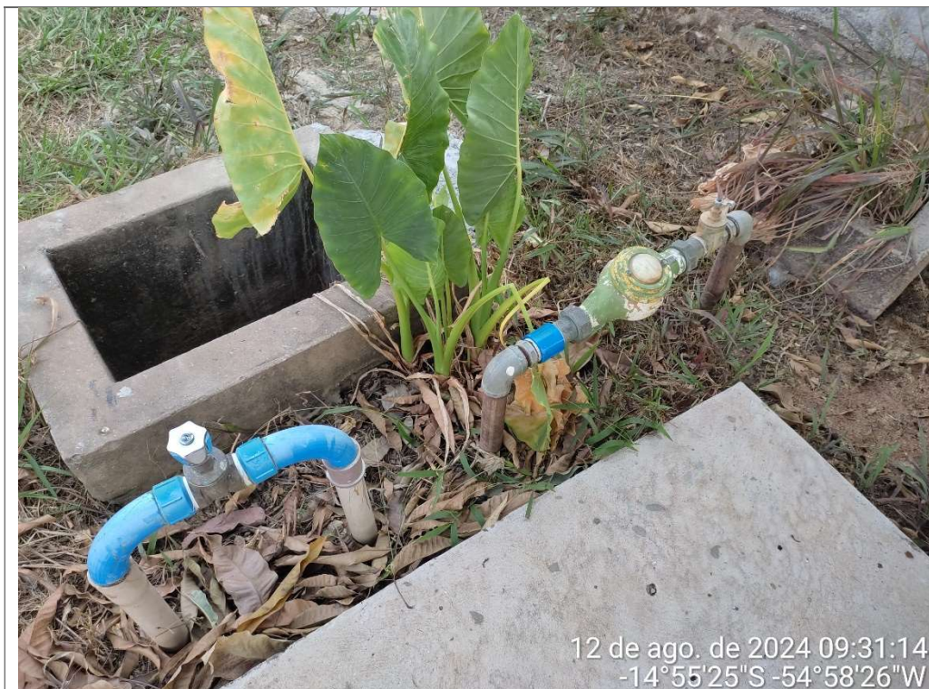
ENTRADA DE ÁGUA