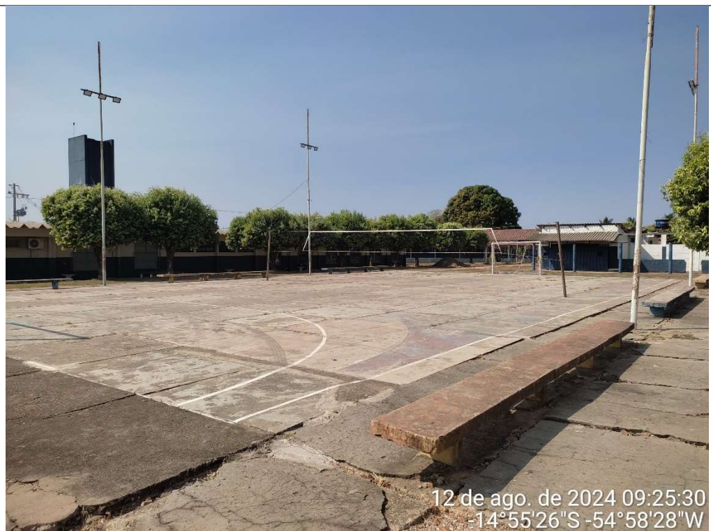
QUADRA POLIESPORTIVA EXISTENTE